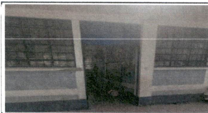
Foto 5: Fabricación e instalación de balcones de hierro en ventana.