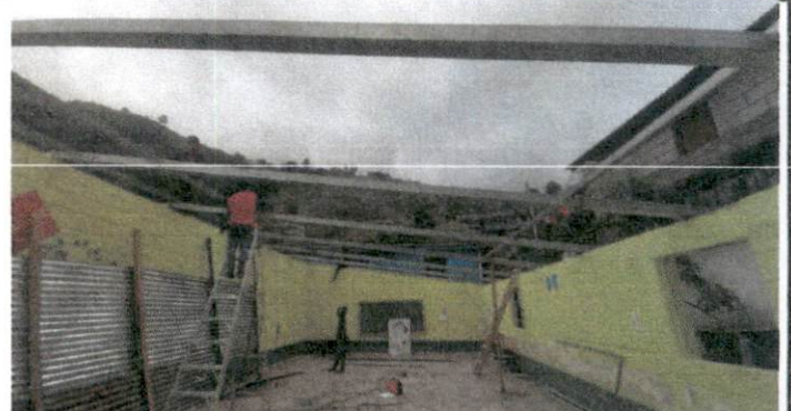
Foto 2: Sustitución de estructura de soporte de madera, por metal.