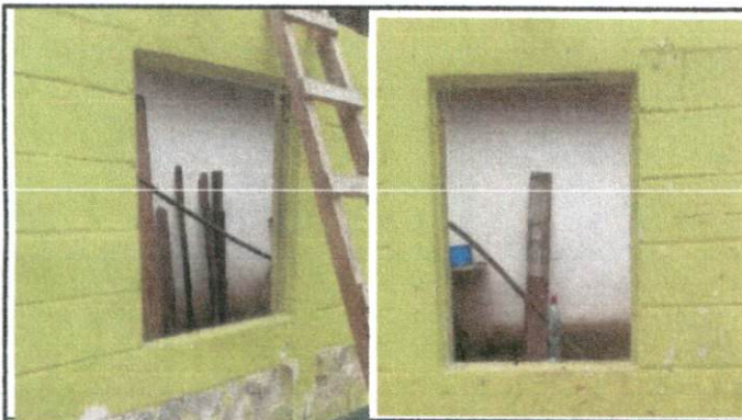
Foto 3: sustitucion de estructura de metal de ventanas y sustitución de vidrios.